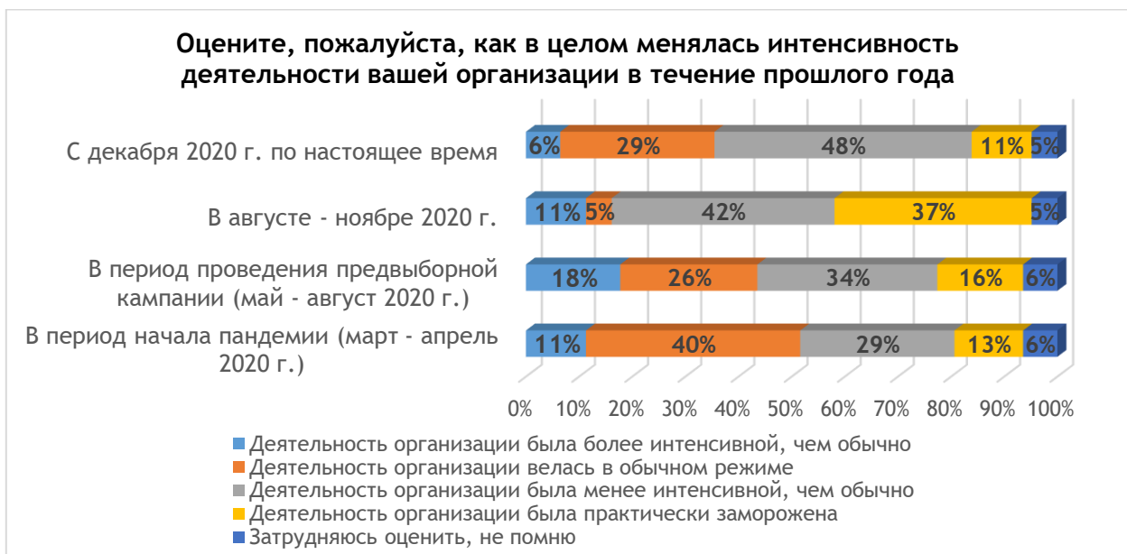
Рис. 1. Изменение интенсивности деятельности организаций

Однако новый виток репрессий, начавшийся с июля 2021 года – на этот раз репрессий институциональных, направленных уже не просто против активистов или организаций, которые каким-то образом включились в протестные действия или активно взаимодействовали с новыми сообществами, а против организаций третьего сектора как таковых, - снова вынуждает ОГО перестраивать свою деятельность и менять приоритеты.